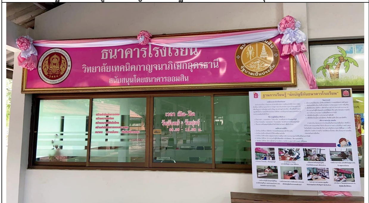
ฐานการเรียนรู้หลักปรัชญาของเศรษฐกิจพอเพียงนักบัญชีกับธนาคารโรงเรียน