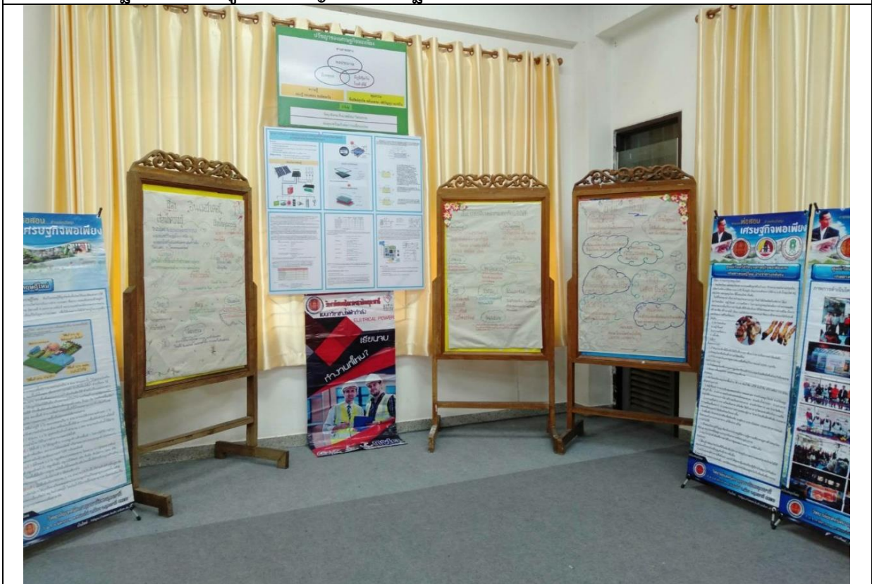
ฐานการเรียนรู้หลักปรัชญาของเศรษฐกิจพอเพียงการออกแบบและการประยุกต์ใช้งานแผ่นโซลาเซลล์ ควบคุมด้วยไมโครคอนโทรลเลอร์