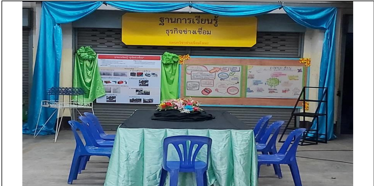
ฐานการเรียนรู้หลักปรัชญาของเศรษฐกิจพอเพียงธุรกิจช่างเชื่อม