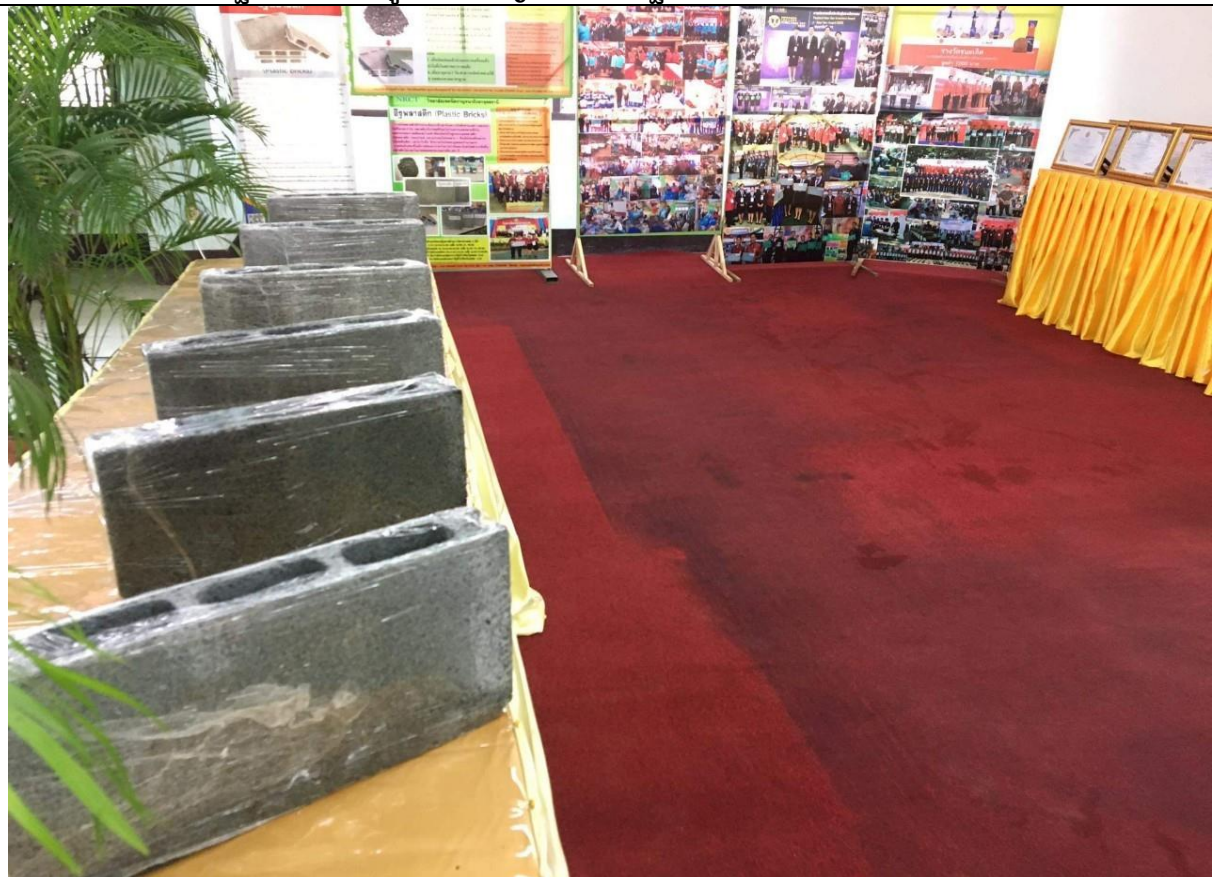
ฐานการเรียนรู้หลักปรัชญาของเศรษฐกิจพอเพียงอิฐพลาสติก