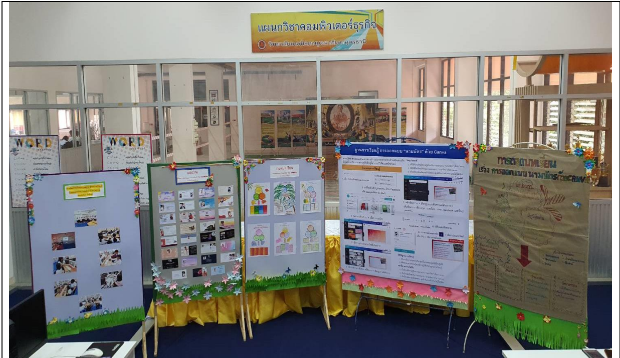
ฐานการเรียนรู้หลักปรัชญาของเศรษฐกิจพอเพียงการออกแบบ "นามบัตร" ด้วย Canva