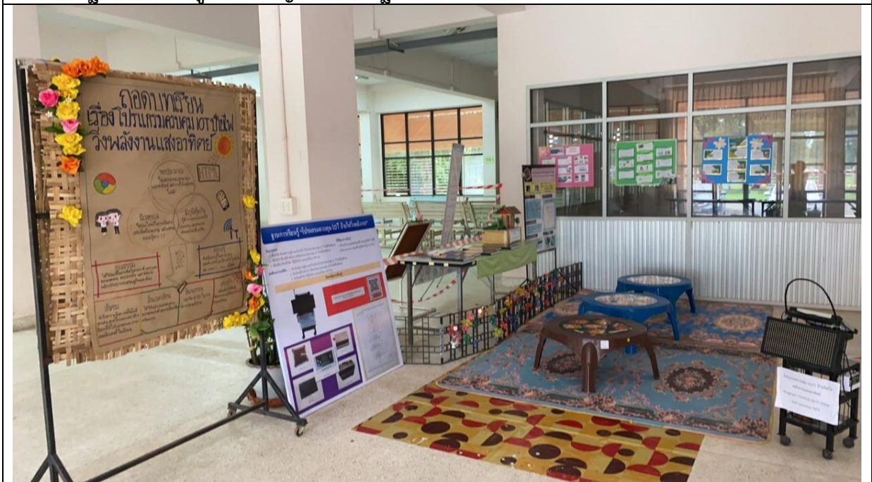
ฐานการเรียนรู้หลักปรัชญาของเศรษฐกิจพอเพียงโปรแกรมควบคุม LOTป้ายไฟวิ่งพลังงานแสงอาทิตย์