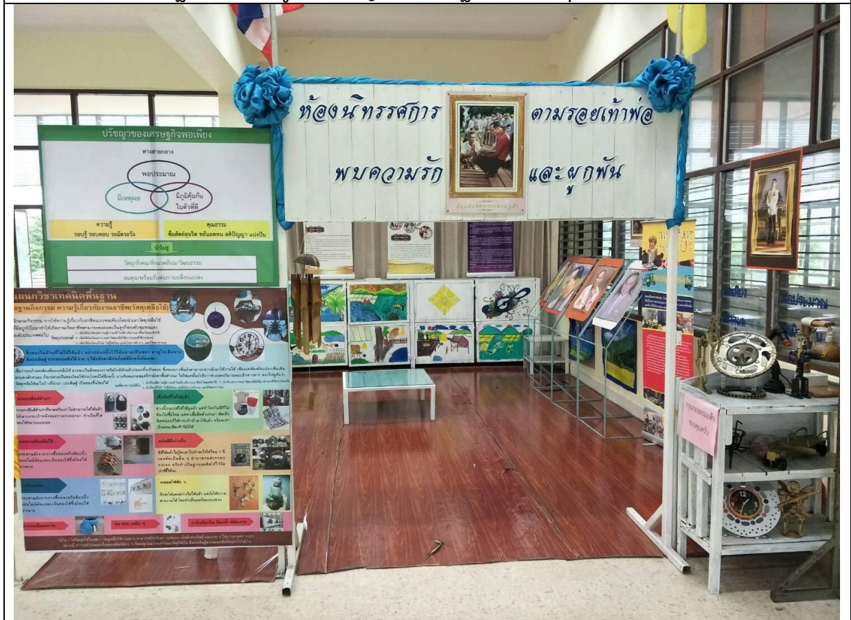
ฐานการเรียนรู้หลักปรัชญาของเศรษฐกิจพอเพียงความรู้เกี่ยวกับงานอาชีพ(วัสดุเหลือใช้)