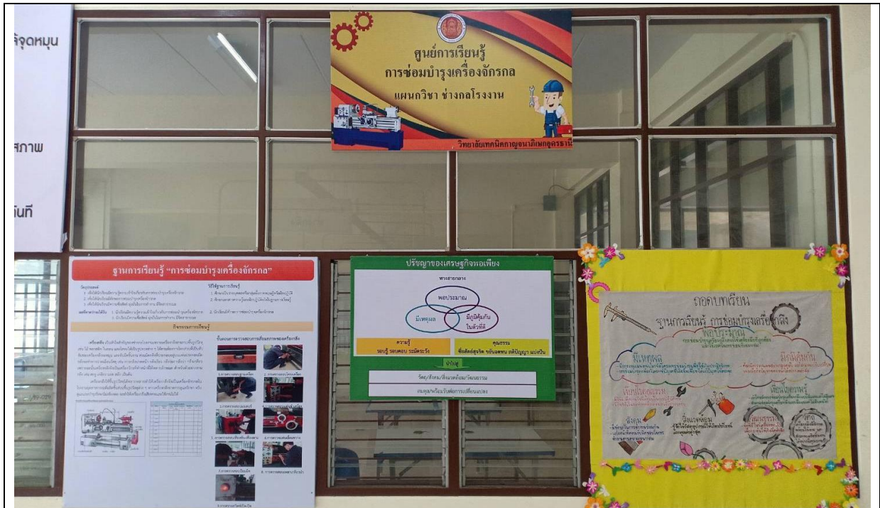
ฐานการเรียนรู้หลักปรัชญาของเศรษฐกิจพอเพียงการซ่อมบำรุงเครื่องจักรกล