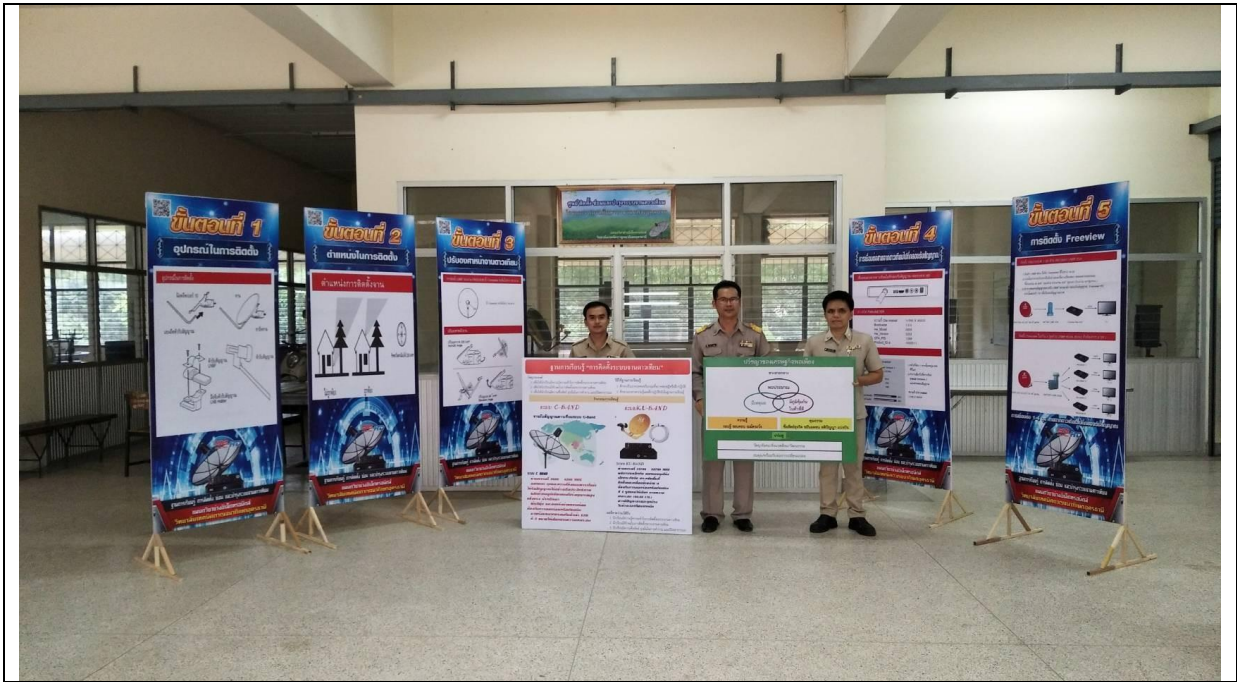
ฐานการเรียนรู้หลักปรัชญาของเศรษฐกิจพอเพียงการติดตั้งระบบจรวดดาวเทียม